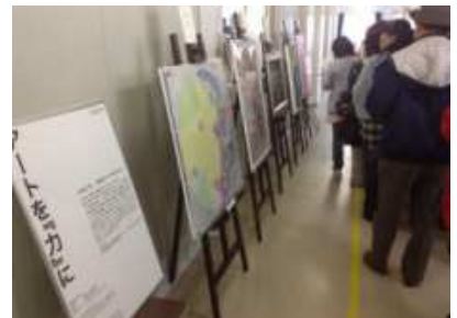
↑東北各地での展示の様子