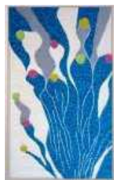
鶴田昌子様「Dream of shining」