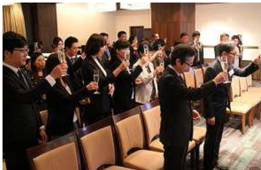
アルビオン社員もお祝いに駆けつけ、全員で乾杯。